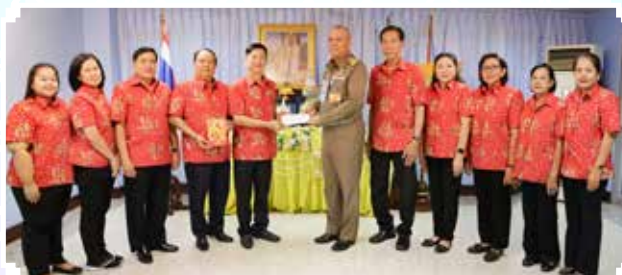
๙ ต.ค. ๖๗ • สสอ.ศร. มอบเงินให้มูลนิธิราชประชานุเคราะห์ ในพระบรมราชูปถัมภ์

การเทศน์มหาชาติ เป็นประเพณีของไทยแต่โบราณ ผู้ใดได้ฟังเทศน์มหาชาติครบ ๑๓ กัณฑ์ จะได้รับอานิสงส์ คือ จะได้เกิดในโลกลุสรวรรค์ เสวยทิพย์สมบัติ มีลาภ ยศ ไม้ตรี และมีความสุข สมาคมเห็นความสำคัญ จึงได้จัดเทศน์มหาชาติ ครั้งนี้เป็นครั้งที่ ๑๓ เพื่อต้องการนำรายได้หลังหักค่าใช้จ่าย สมทบทุนองค์กรสาธารณกุศล เพื่อสมทบเป็นทุนการศึกษา แก่เด็กนักเรียนที่ยากไร้ เพื่อสมทบทุนจัดซื้ออุปกรณ์ทางการแพทย์โรงพยาบาลครู สกสค. และเพื่อใช้ในกิจกรรมสมาคม ฅาปนกิจสงเคราะห์ สอ.ศร.