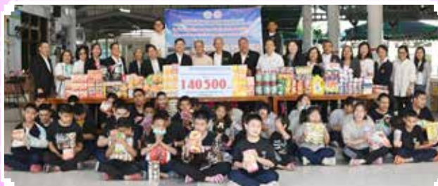
๒๐ ธ.ค. ๖๘ • สสอ.ศร. ร่วมกับ สอ.ศร. มอบเงินบริจาค ให้โรงเรียนธรรมมิทวิทยา จังหวัดเพชรบุรี