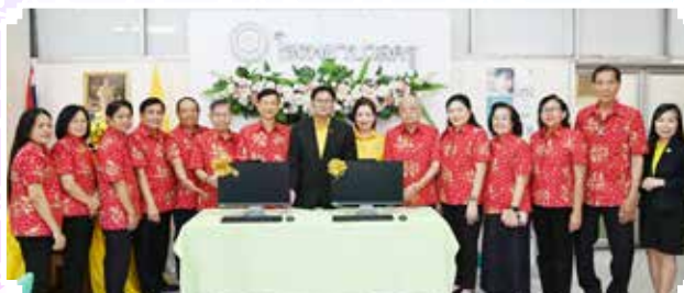
๓๐ ก.ย. ๖๗ • สสอ.ศร. มอบคอมพิวเตอร์ จำนวน 2 เครื่อง ให้โรงพยาบาลครู