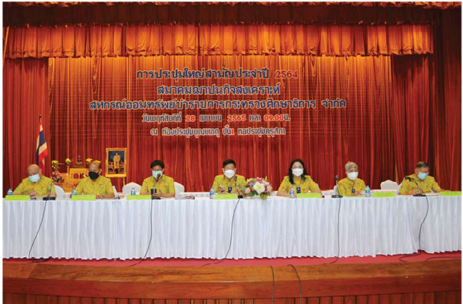
28 เม.ย. 65 • สมาคมพัฒนากิจสงเคราะห์สภากาชาดอภพรพชัราราชการกระทรวงศึกษาธิการ จำกัด จัดการประชุมใหญ่สามัญ ประจำปี 2564 ณ หอประชุมคุรุสภา กระทรวงศึกษาธิการ