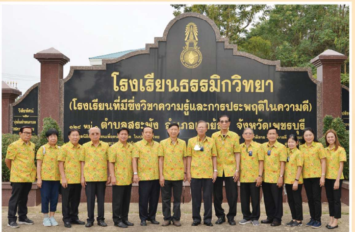
17 ธ.ค. 65 • สมาคมฌาปนกิจสงเคราะห์สภครุฑออมทรัพย์ข้าราชการกระทรวงศึกษาธิการ จำกัด มอบเงินบริจาคเพื่อเป็นทุนการศึกษาเด็กนักเรียนตาบอด ณ โรงเรียนธรรมิกวิทยา จังหวัดเพชรบุรี