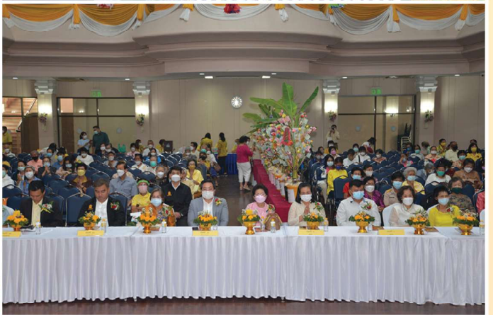
7 พ.ย. 65 • สมเด็จพระมหาธีรราชมงคลมุนี (ธงชัย ธมฺมธโช) วัดไตรมิตรวิทยารามวรวิหาร เป็นองค์ประธานพิธีเทศน์มหาชาติ มหาเวสสันดรชาดก จัดโดย สมาคมฌาปนกิจสงเคราะห์สภครุฑออมทรัพย์ข้าราชการกระทรวงศึกษาธิการ จำกัด ร่วมกับ สภครุฑออมทรัพย์ข้าราชการกระทรวงศึกษาธิการ จำกัด ณ ห้องประชุมบุญฤๅณเฑศ หอประชุมคุรุสภา กระทรวงศึกษาธิการ