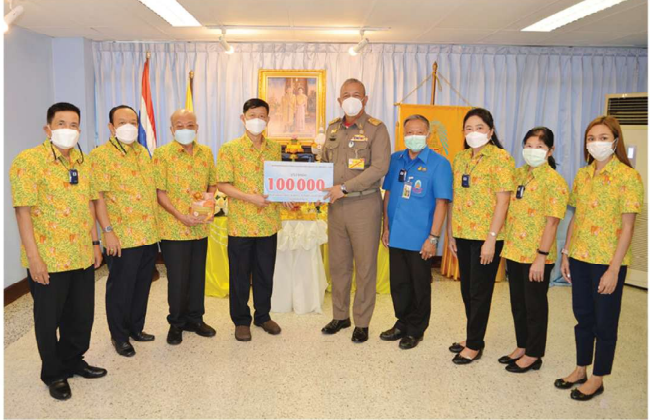
16 ธ.ค. 65 • สมาคมพัฒนากิจสงเคราะห์สภากาชาดอภพรพชัราราชการกระทรวงศึกษาธิการ จำกัด มอบเงินให้มูลนิธิราชประชานุเคราะห์ ในพระบรมราชูปถัมภ์