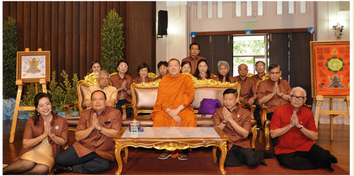
สมาคม จัดเทศน์มหาชาติ “เวสสันดรชาดก” ณ หอประชุมคุรุสภา กระทรวงศึกษาธิการ วันจันทร์ที่ 17 กันยายน 2561