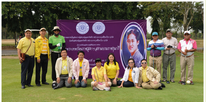
สมาคม จัดแข่งขันกอล์ฟการกุศล ฯ ณ สนามกอล์ฟ นอร์ธเทิร์น รังสิต กอล์ฟคลับ จังหวัดพระนครศรีอยุธยา วันศุกร์ที่ 30 พฤศจิกายน 2561