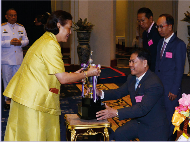
สมาคม ทูลเกล้า ฯ ถวายเงิน สมเด็จพระเทพรัตนราชสุดา ฯ สยามบรมราชกุมารี ณ ศาลาดุสิดาลัย สวนจิตรลดา วันจันทร์ที่ 7 มกราคม 2562