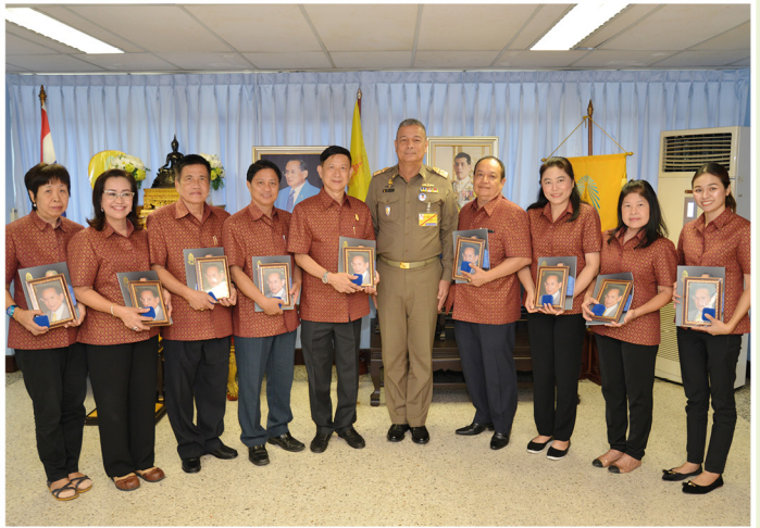
สมาคม มอบเงินมูลนิธิราชประชานุเคราะห์ ในพระบรมราชูปถัมภ์ วันอังคารที่ 6 พฤศจิกายน 2561