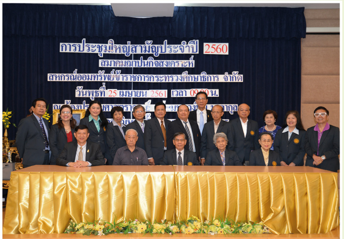
การประชุมใหญ่สามัญ ประจำปี 2560 ณ ห้องประชุมศาสตราจารย์หม่อมหลวงปิ่น มาลากุล กระทรวงศึกษาธิการ วันพุธที่ 25 เมษายน 2561