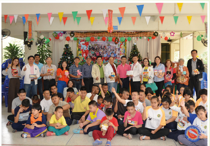
สมาคม มอบเงินบริจาคให้โรงเรียนธรรมิกวิทยา จังหวัดเพชรบุรี วันอาทิตย์ที่ 23 ธันวาคม 2561